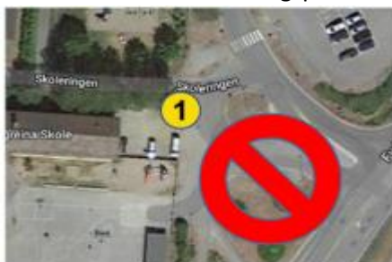
Rundkjøring ved skolen

På grunn av sikkerheten til elevene, er det kun et sted foresatte kan stoppe bilen når de leverer eller henter sine barn: Parkeringsplassen ved barnehagen.