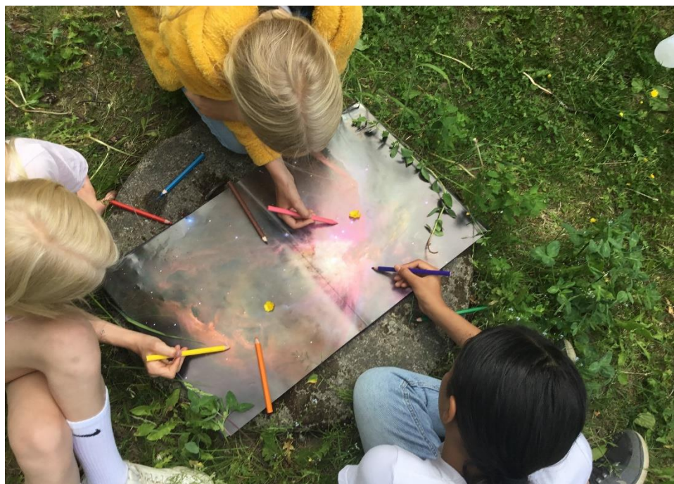
Fotoprojekt elever skoleåret 2019-2020