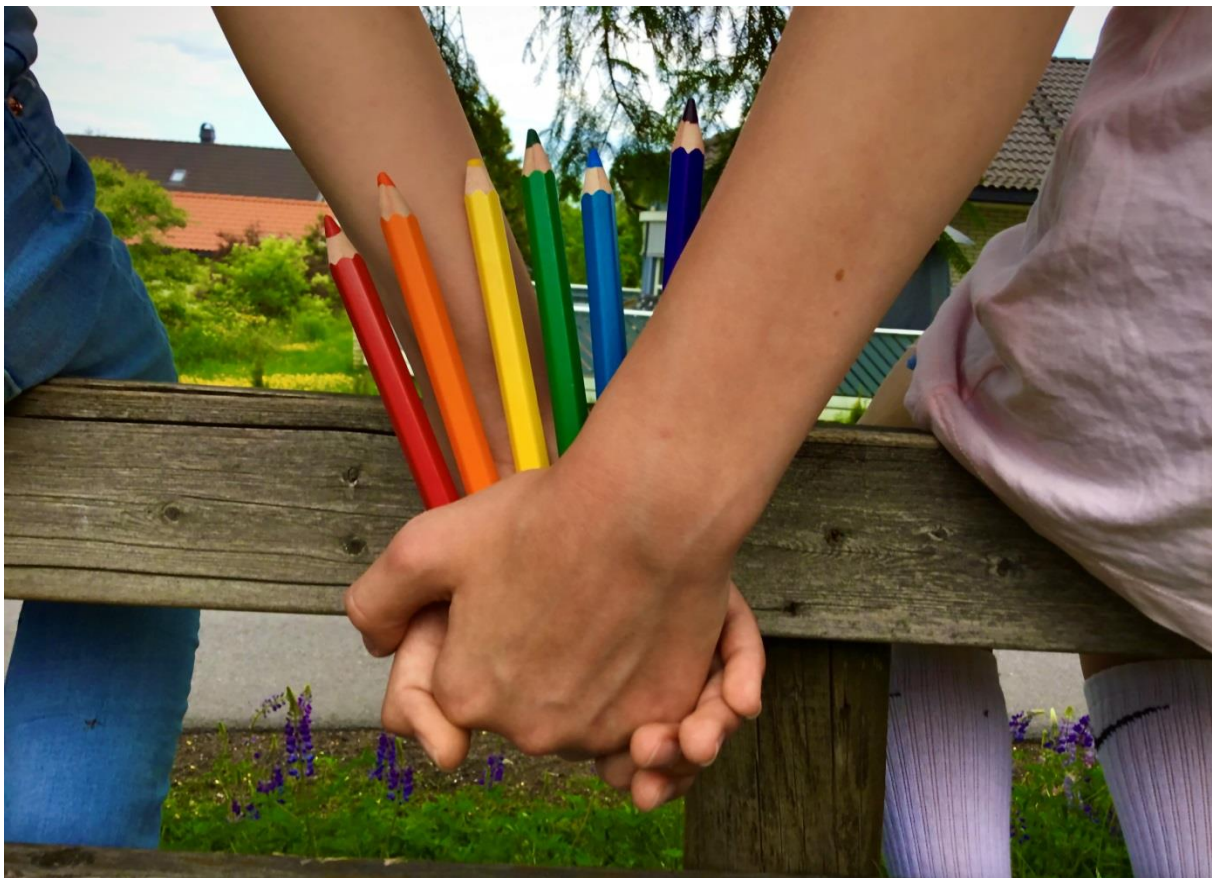
Fotoprojekt skoleåret 2019-20. «Inkludering»

Skolen og ressursteam samarbeider også med barnevernet, BUP (Barne – og ungdomspsykiatriske poliklinikk) og FABU (Forebyggende avdeling barn og unge)