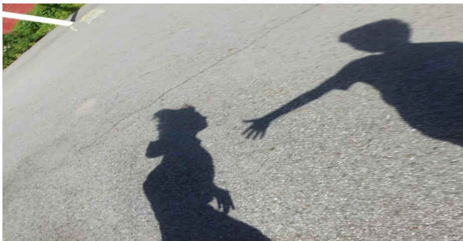
Fotoprojekt skoleåret 2019-20 «Inkludering»