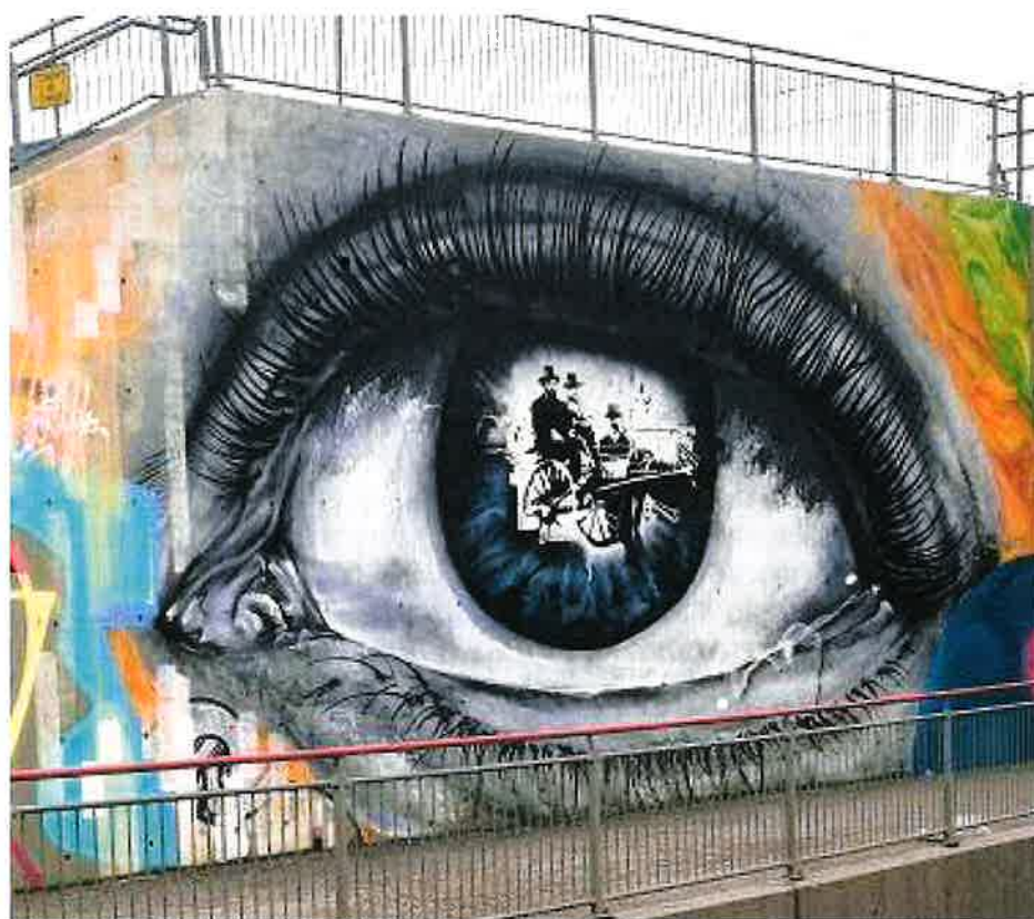
Kunst i Ullensaker