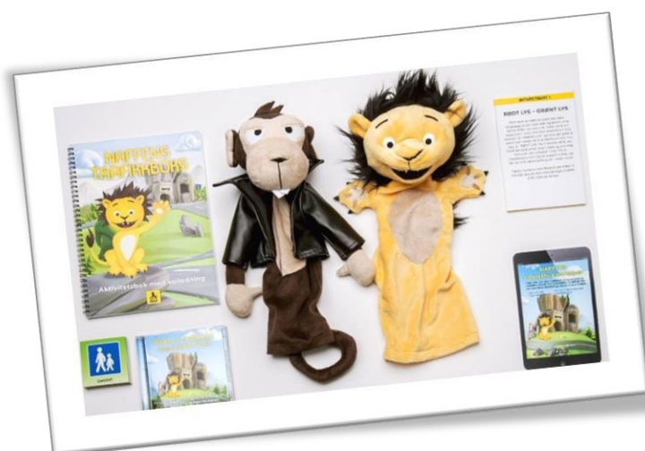
Naffens trafikkboks.