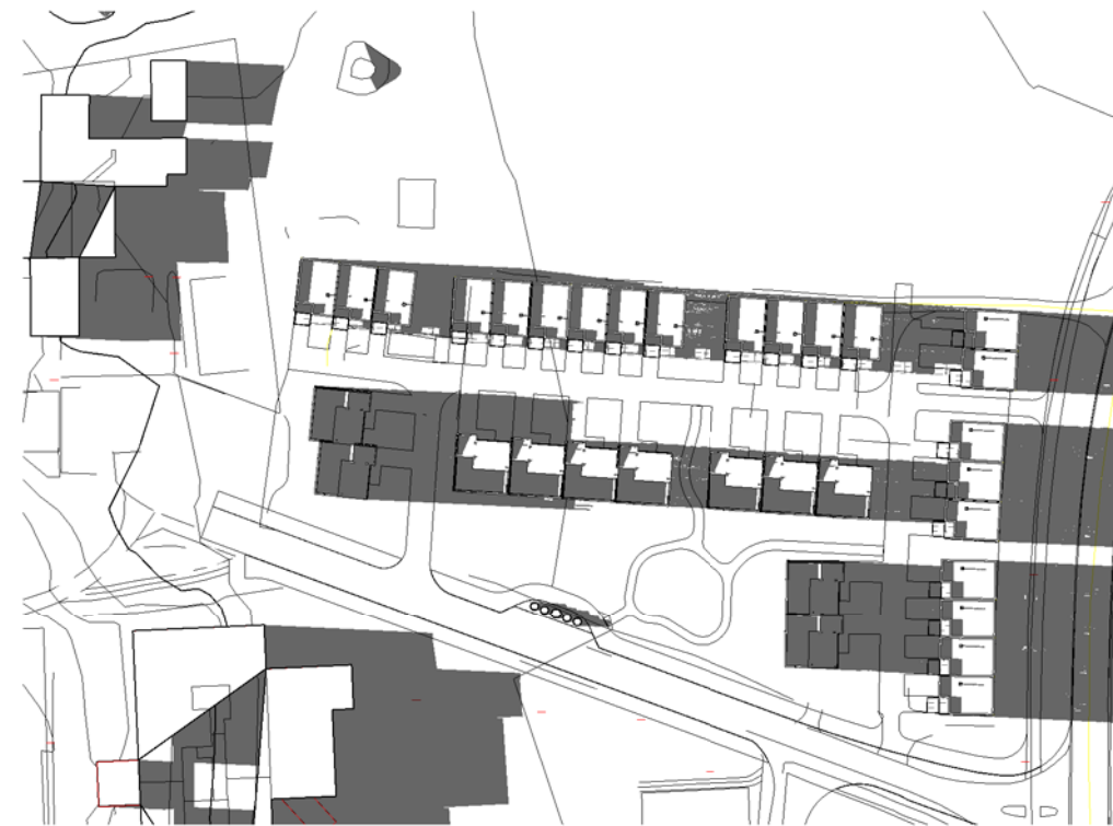
21 April kl 1800