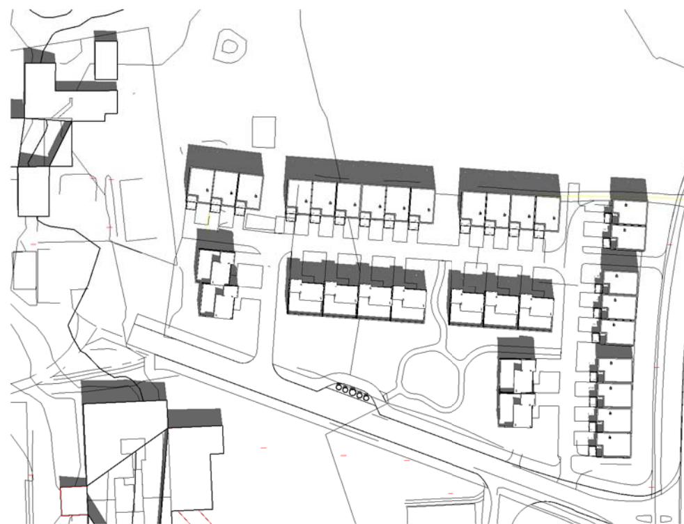
21 Juni kl 1200