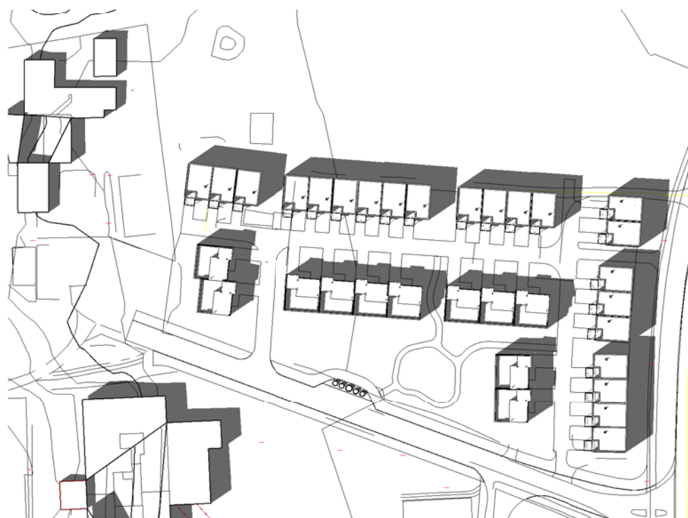
21 Juni kl 1500