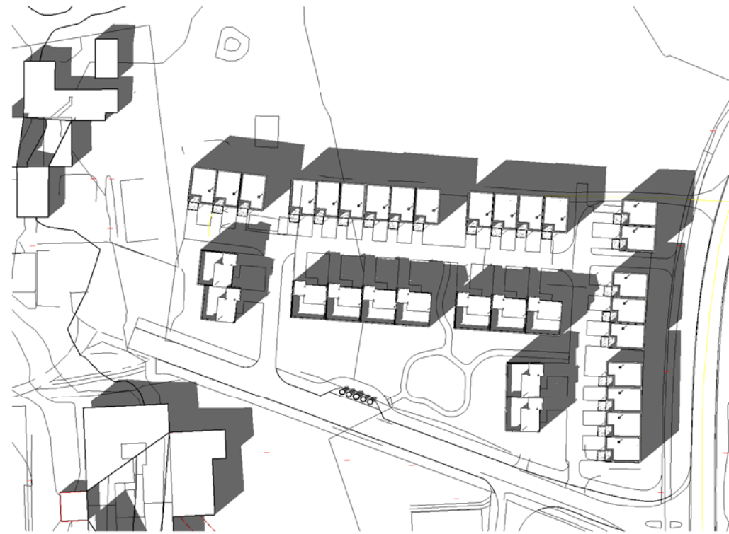
21 April kl 1500