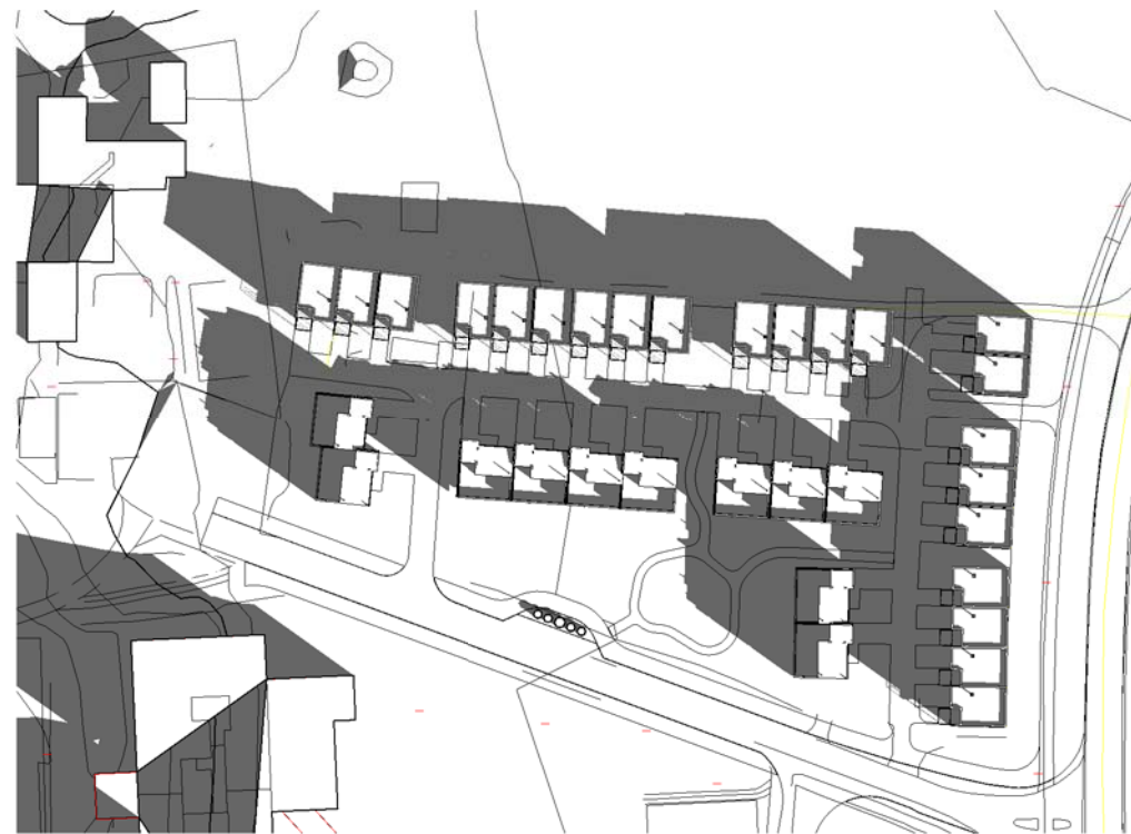
21 Mars kl 0900