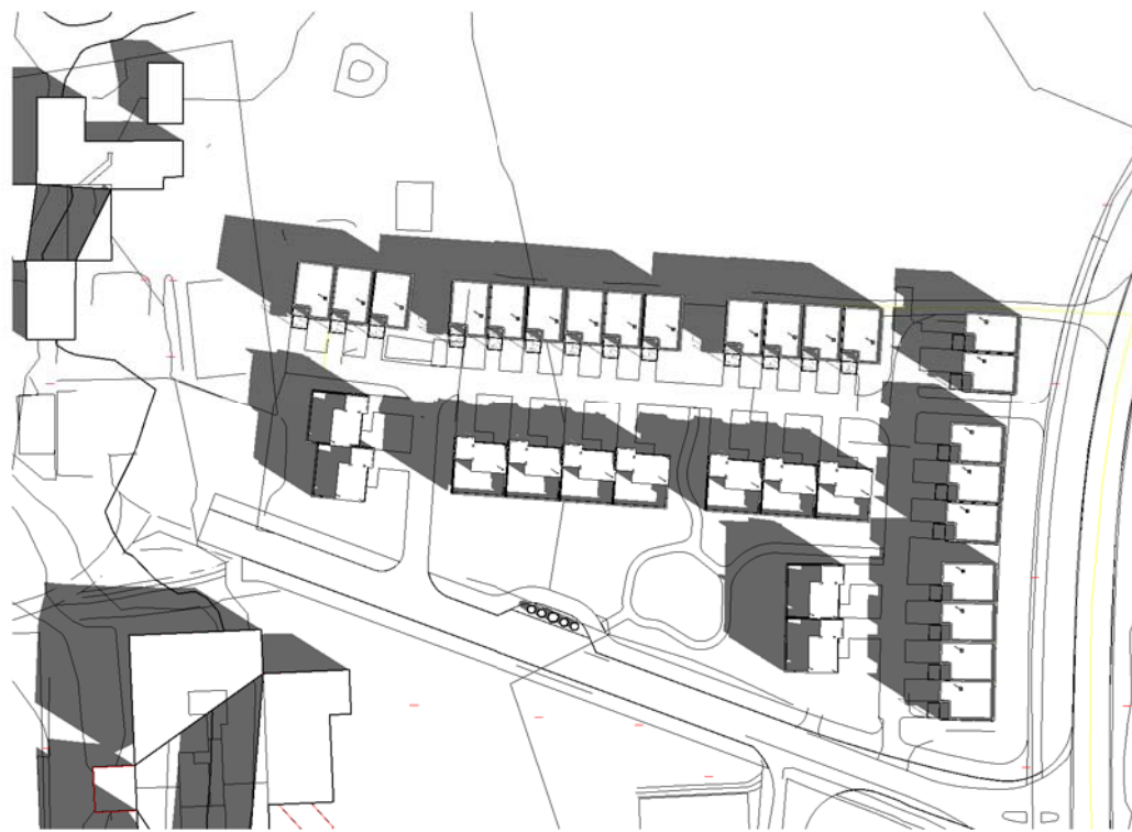
21 April kl 0900