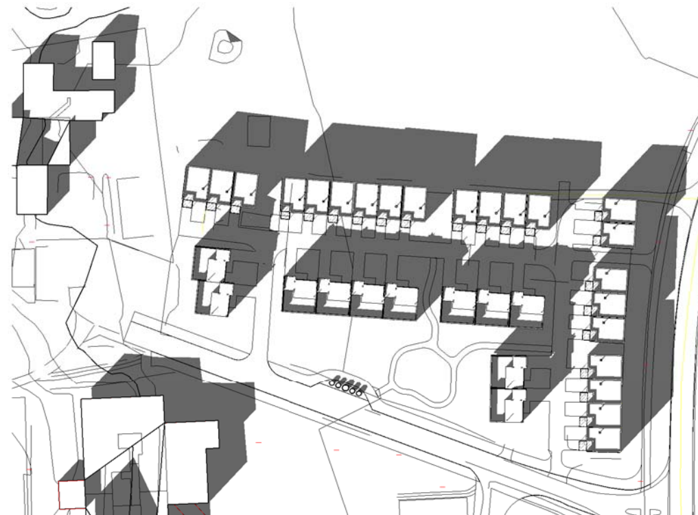
21 Mars kl 1500