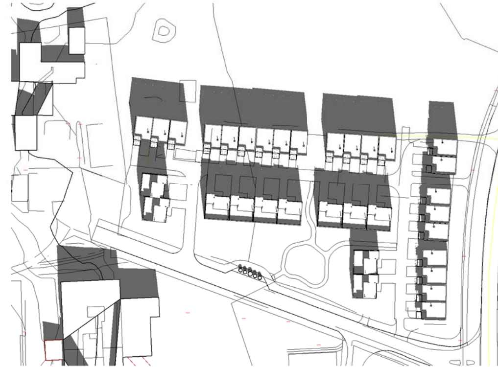
21 Mars kl 1200