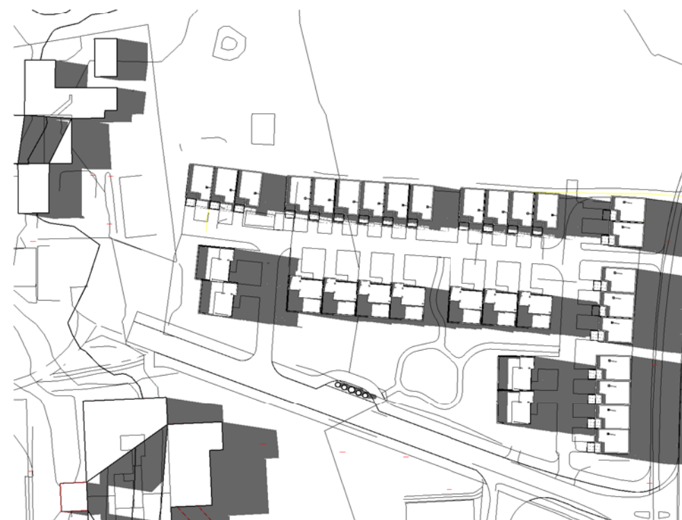
21 Juni kl 1800