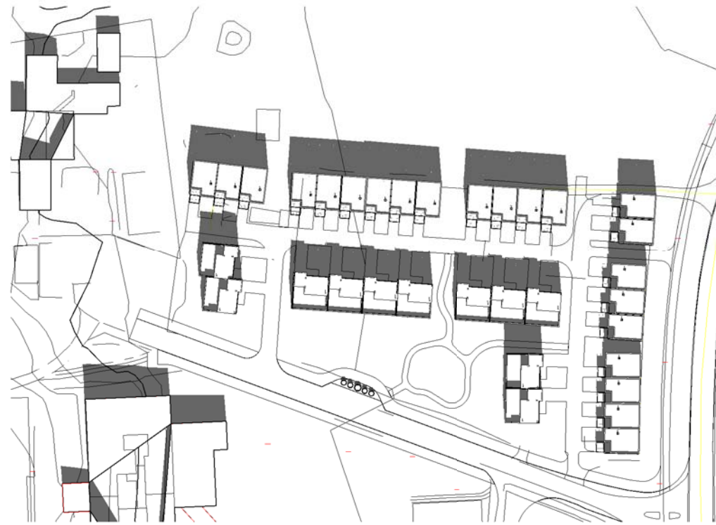
21 April kl 1200