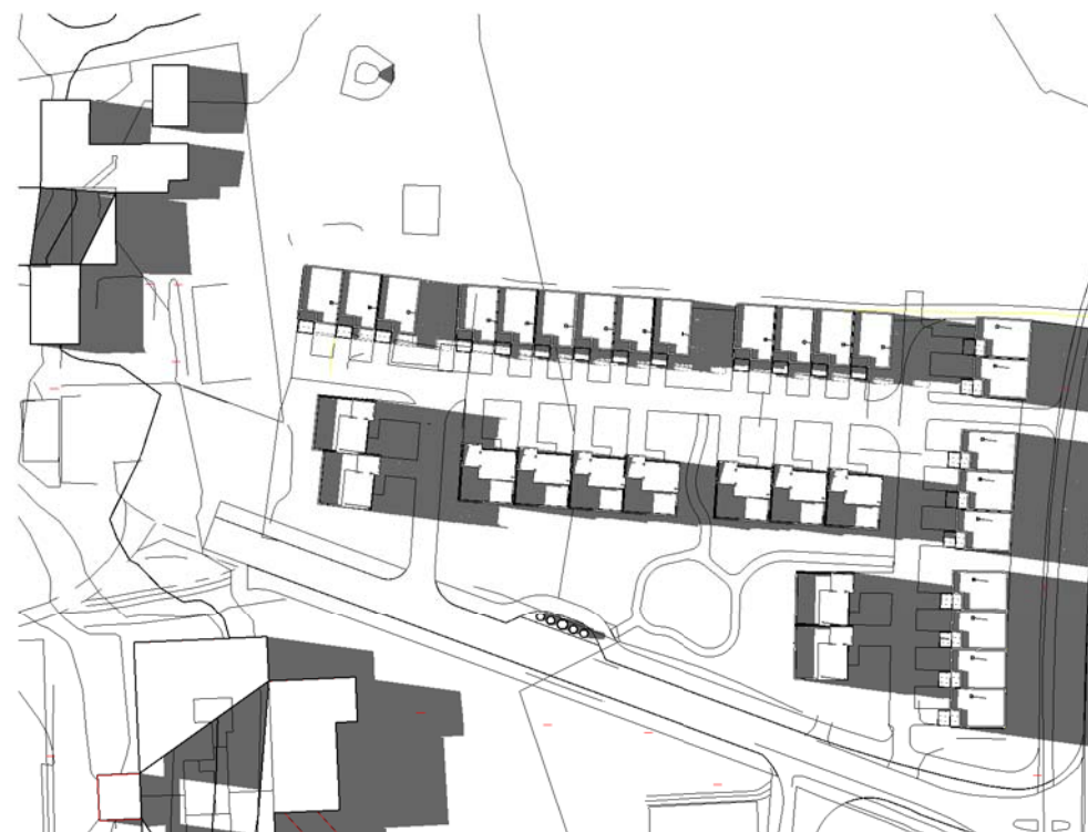
21 Mai kl 1800