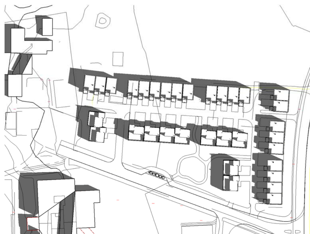
21 Juni kl 0900