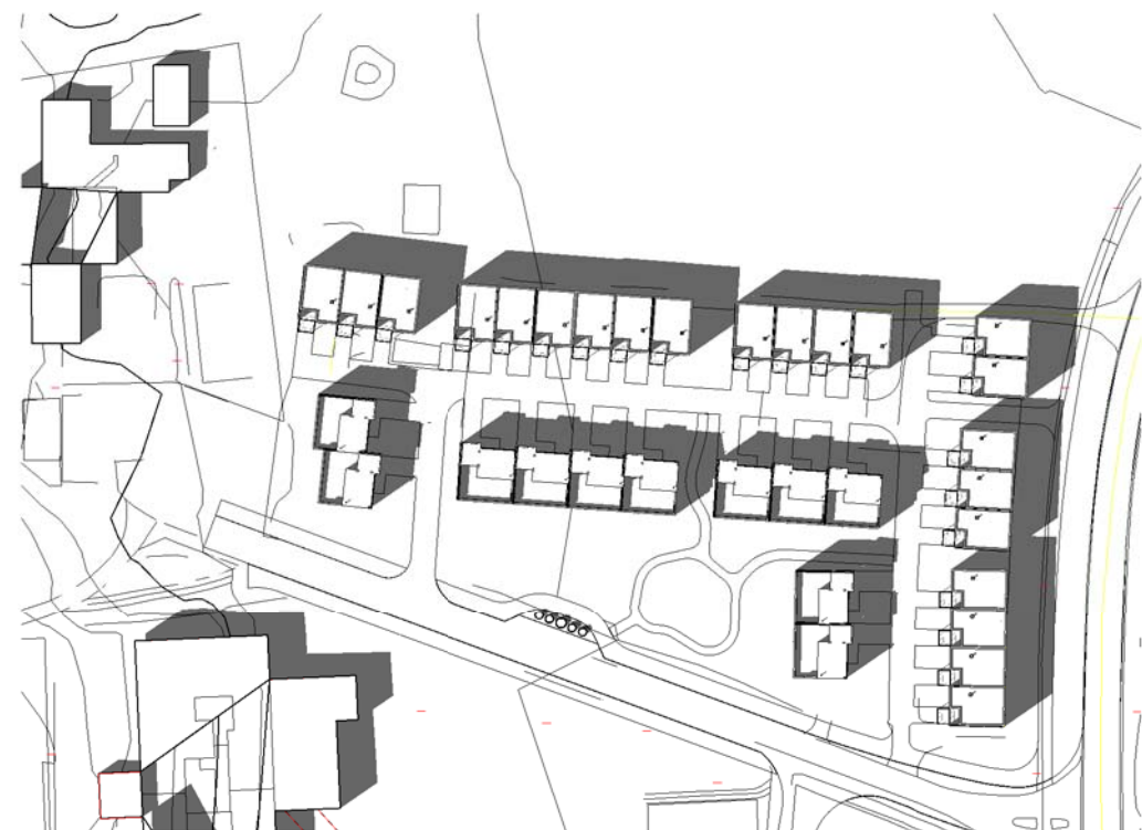
21 Mai kl 1500