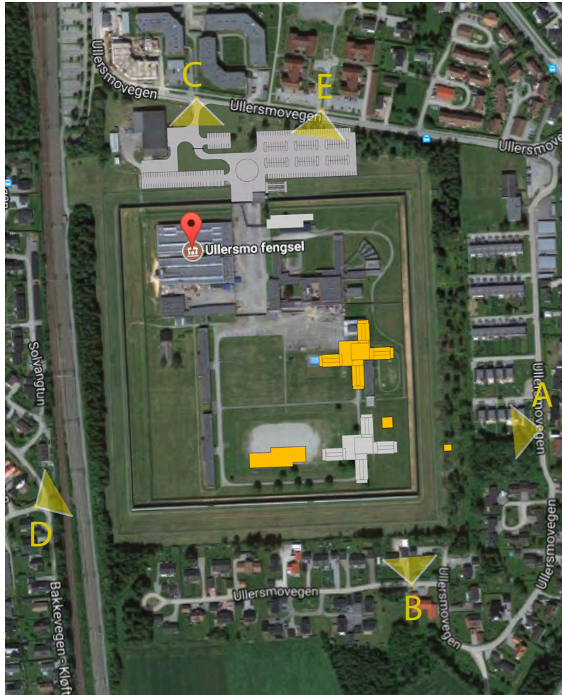
Oversiktskart markert med standpunkt A-D