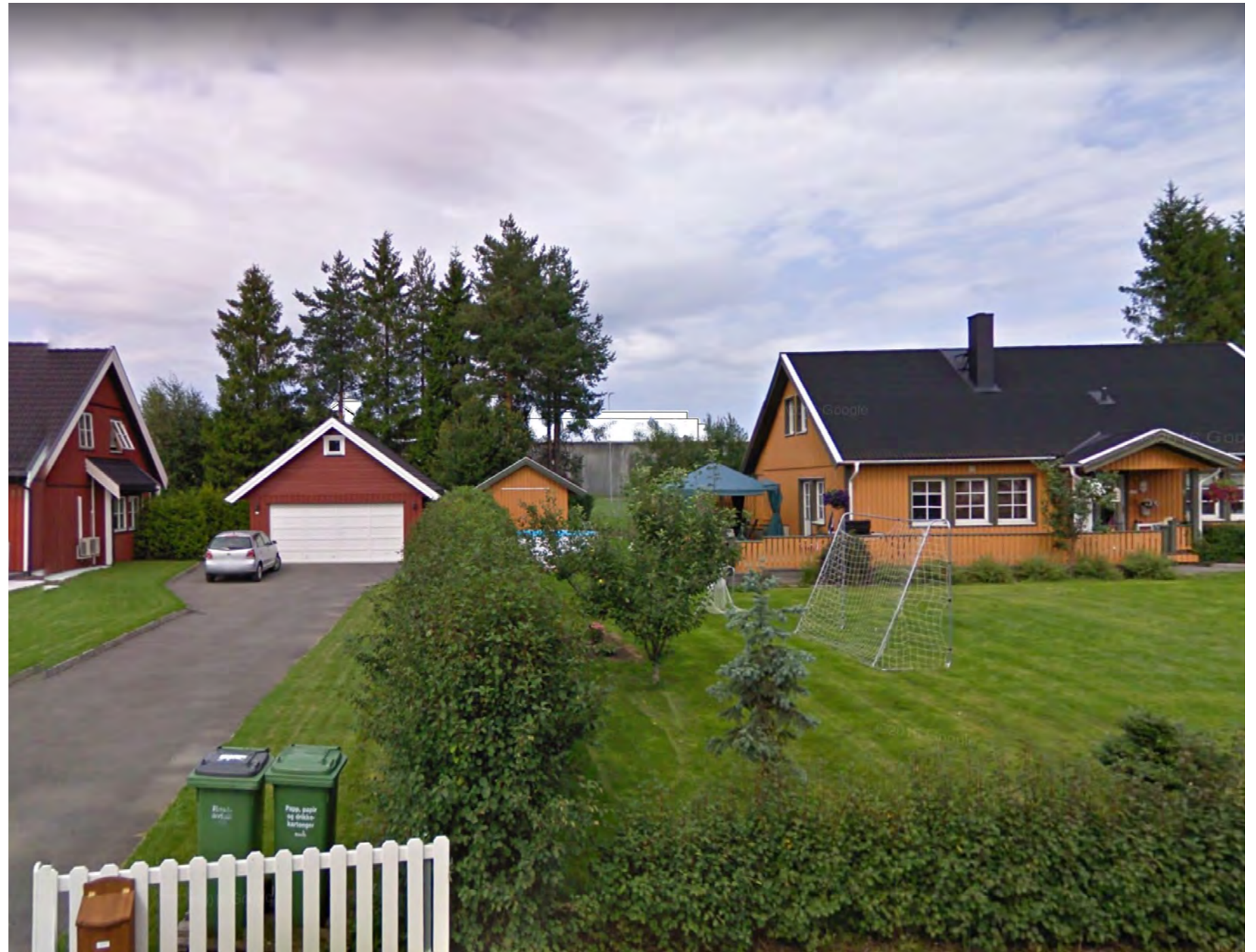
Sikt fra søndre del av Ullersmovegen (Ullersmoveien 62)