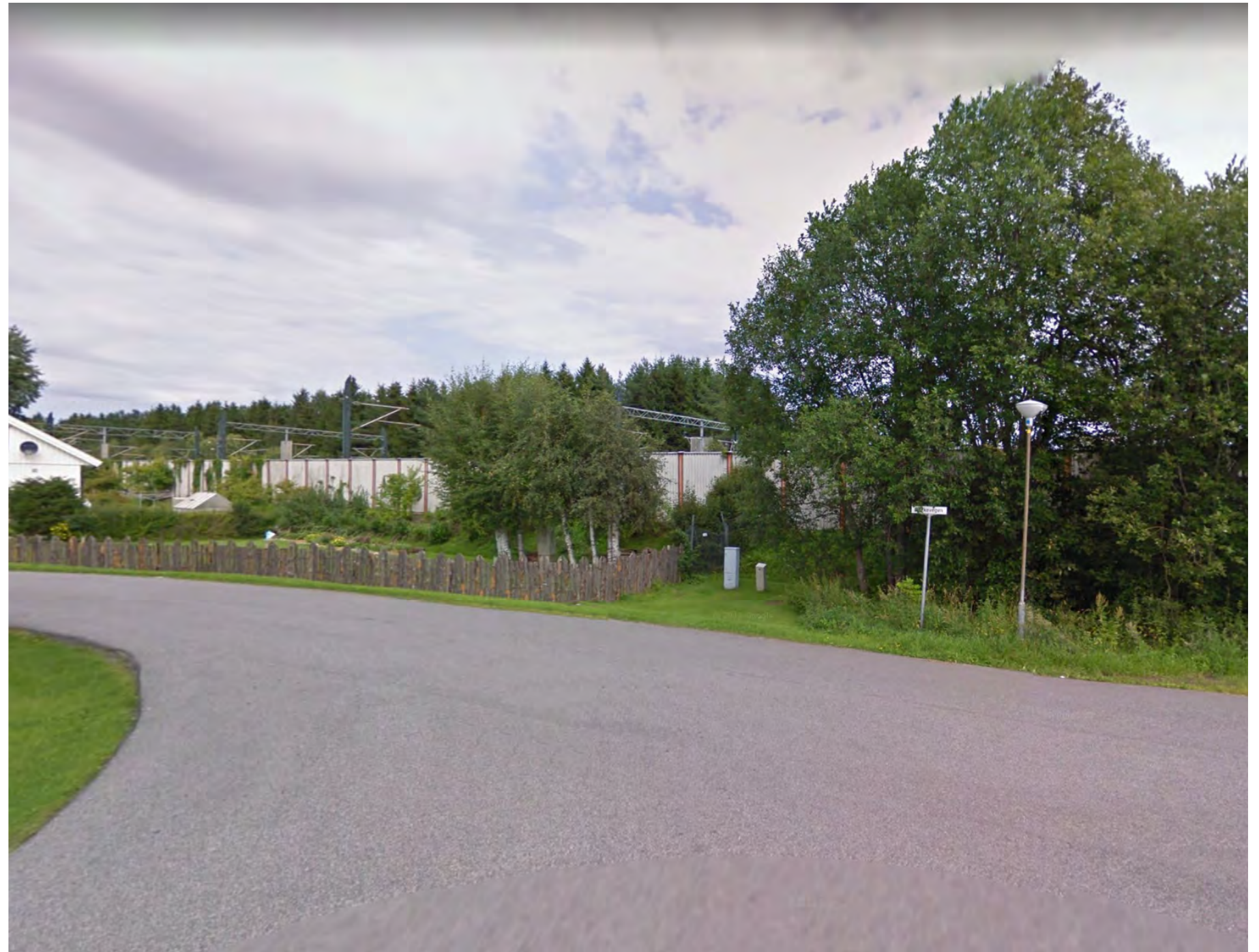
Sikt fra Bakkevegen - Kløfta