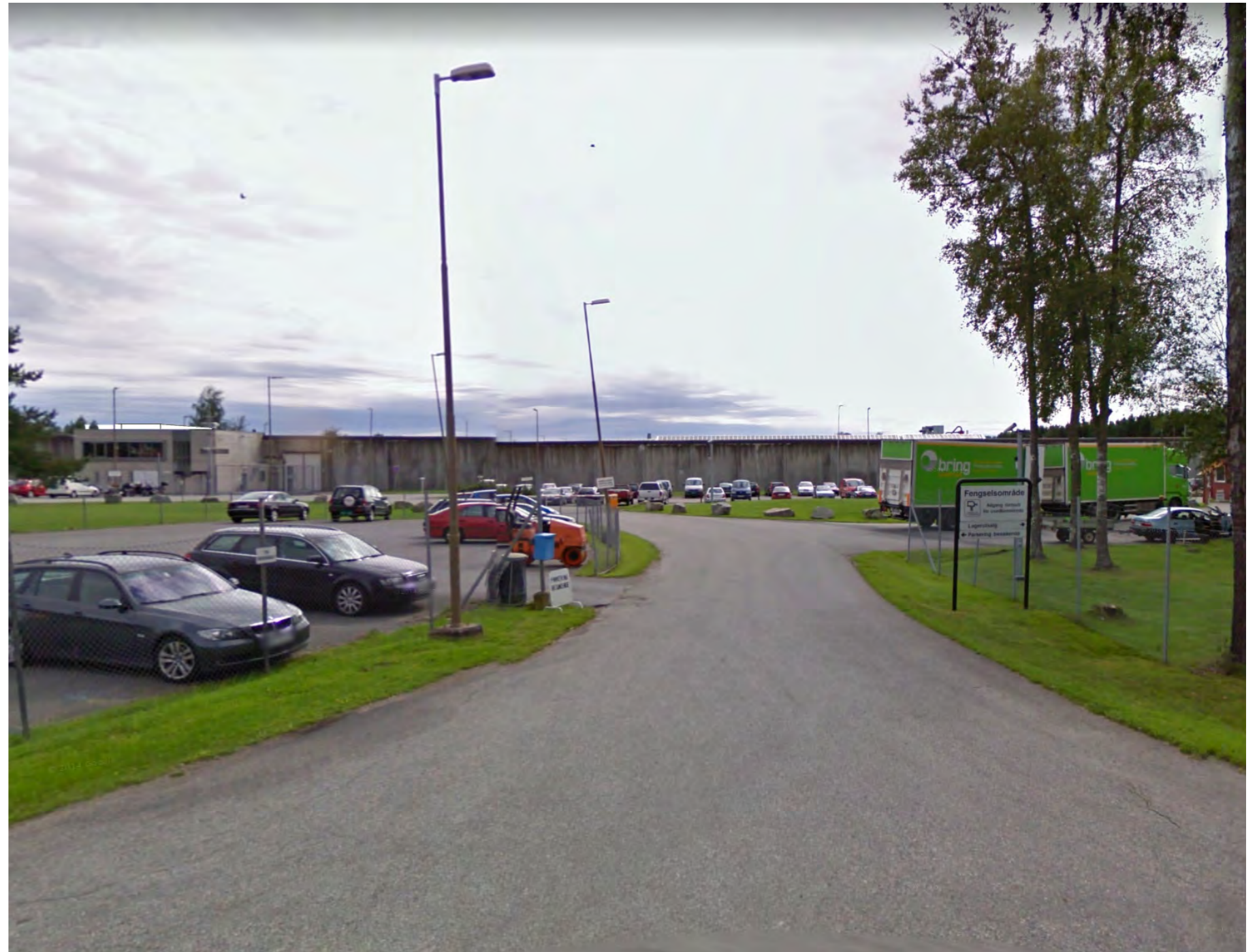
Sikt fra nordre del av Ullersmovegen - hovedadkomst til Ullersmo fengsel