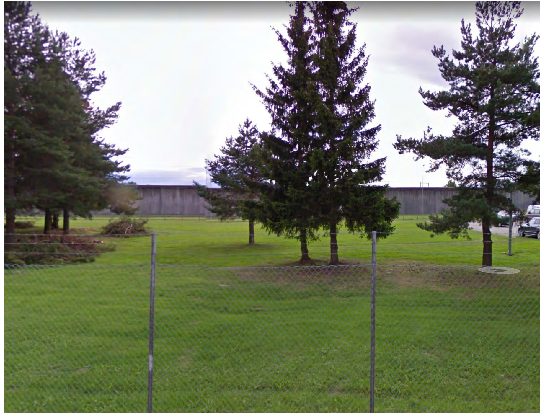
Sikt fra nordre del av Ullersmovegen. Sett mot mottaksbygget.