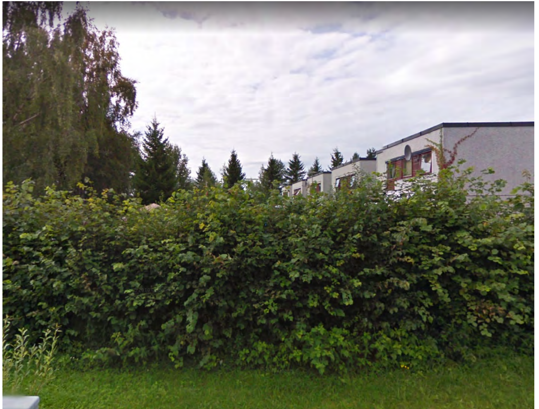
Sikt fra østlig del av Ullersmovegen (Ullersmoveien 17)