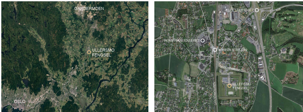
Oversiktskart over Romerike fengsel, avdeling Ullersmo i regionalt (t.v.) og lokalt perspektiv (t.h.). Planområdet er lokalisert 200 m fra Kløfta stasjon, 35 km nord for Oslo og 15 km sør for Gardermoen.