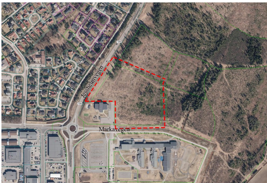
Figur 1 – Planområdet er markert med rød stiplet linje.

I henhold til plan- og bygningslovens § 12-8, varsles det herved om oppstart av detaljregulering for Gystadmarka Felt B2 i Ullensaker kommune. Arcasa arkitekter as utarbeider reguleringsplanen på vegne av Fredensborg Bolig AS.