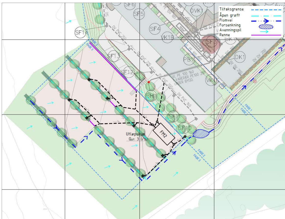
Figur 2: Planlagt overvannssystem for parkeringsplass