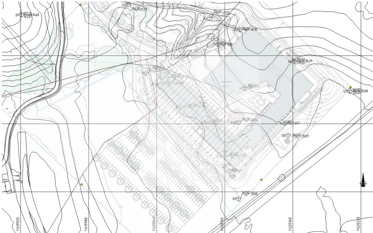
Figur 2.1: Plantegning for fase 2 av hotell med parkeringsplass sørvest for bygg