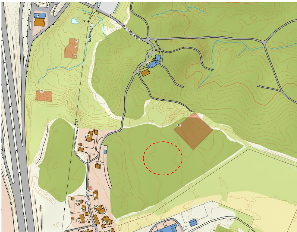
Figur 1.1: Oversiktskart med tiltaksområdets omtrentlige beliggenhet indikert med rød sirkel

Eksisterende grunnundersøkelser indikerer store dybder til fjell, og homogene grunnforhold med siltig leire/kvikkleire.