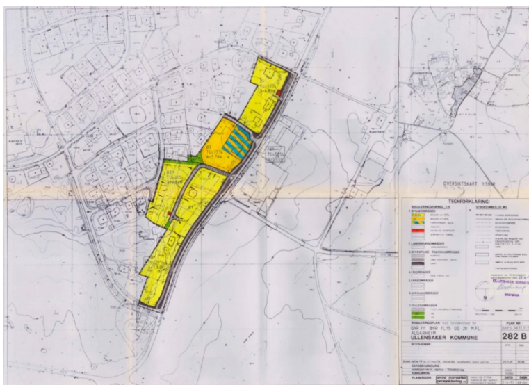
Figur 2: Gang- og sykkelvegen er allerede regulert på store deler av den aktuelle strekningen.

Statens vegvesen viser til «Regional plan for areal transport i Oslo og Akershus», vedtatt i Akershus fylkeskommune desember 2015, om at all trafikkvekst skal skje med sykkel, gange og kollektivt. Det er et overordnet politisk mål, forankret i Akershus fylkeskommune og Miljøverndepartementet, om at fotgjengere og syklistene skal prioriteres før biltrafikk. For å legge til rette for dette er det viktig å gjøre det attraktivt for folk å velge dette alternativet.