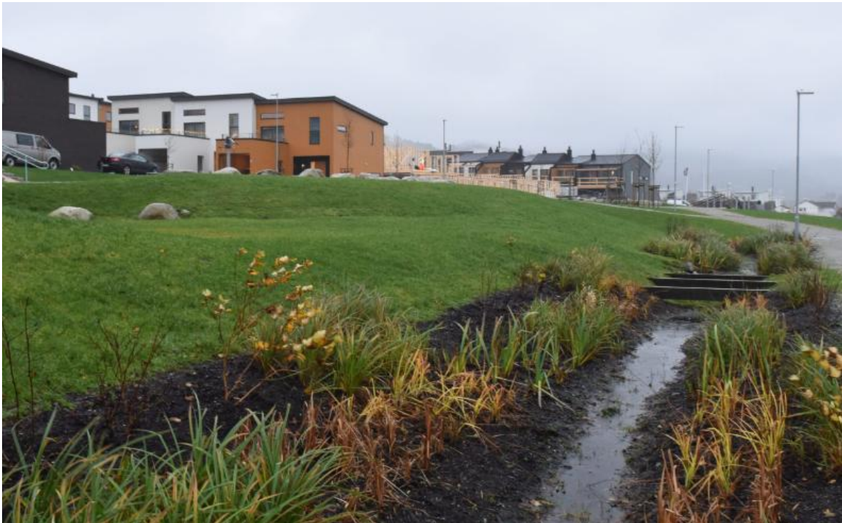
Eksempel på overvannshåndtering lokalt