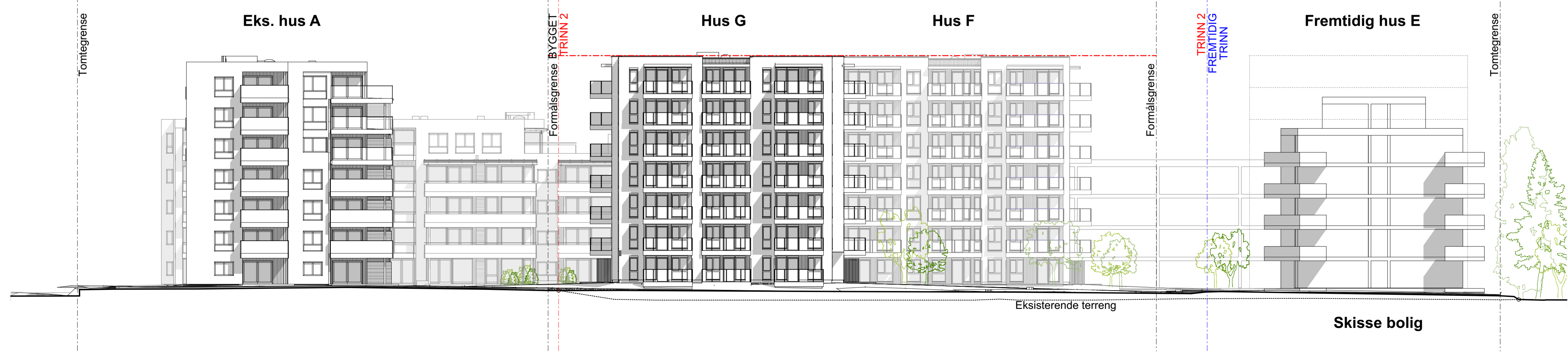
1:250 Fasade Vest