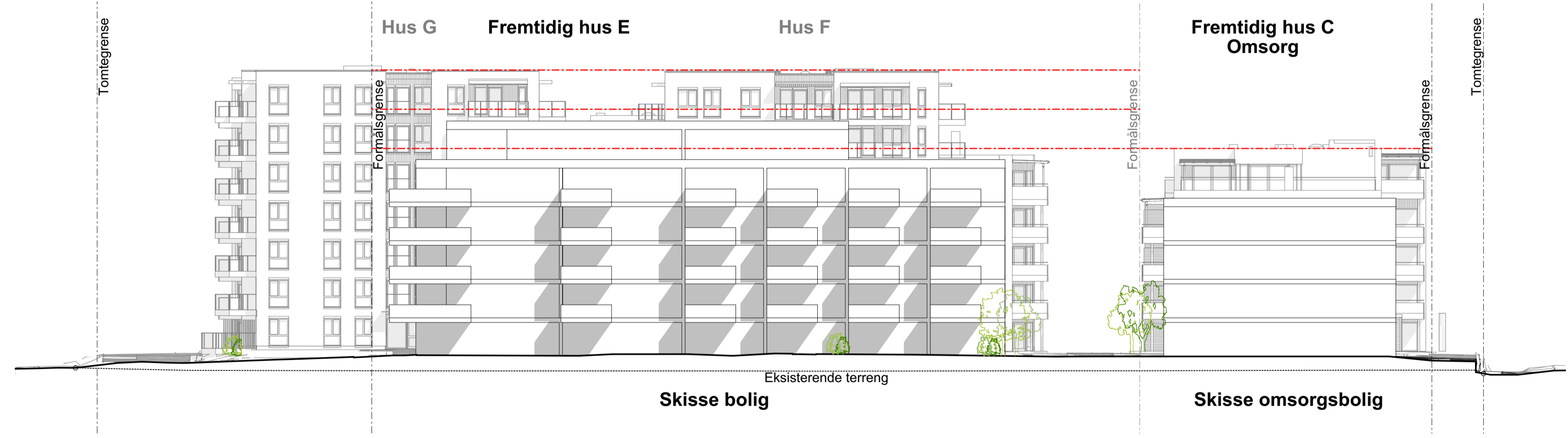
1:250 Fasade Sør