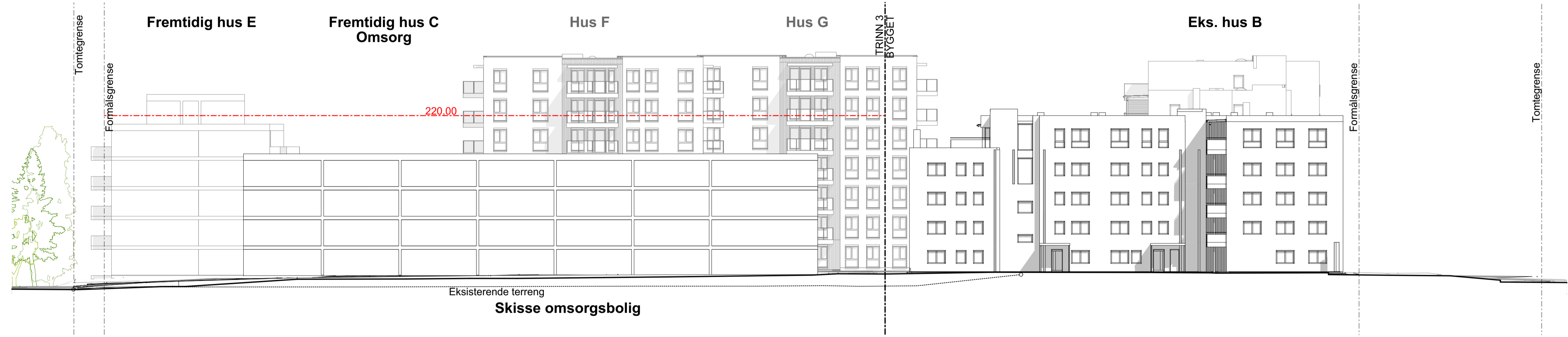
1:250 Fasade Øst