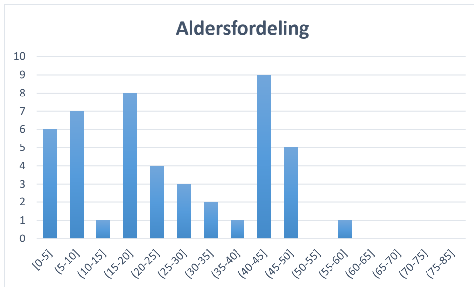
Figur 3 Aldersfordeling blant de smittede i Ullensaker kommune uke 31-32