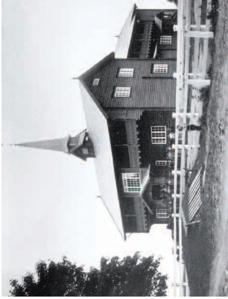
Herredshuset slik det sto i 1901.

Men det gikk ikke lenge før det kom ønske om utbedringer og ombygging. Sinding-Larsen ble igjen kontaktet, og i 1923 startet arbeidet med å reparere og bygge om huset. Arbeidene ble like dyre som selve byggingen drøyt 20 år