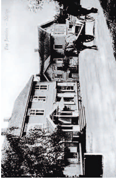
Fra Jessheim - Norge