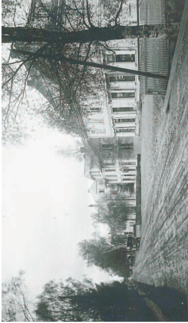
Foto malsatt side: Storgata ca 1930, Solheim lengst til høyre. Solheim før ombyggingen, med meieriet i bakgrunnen.